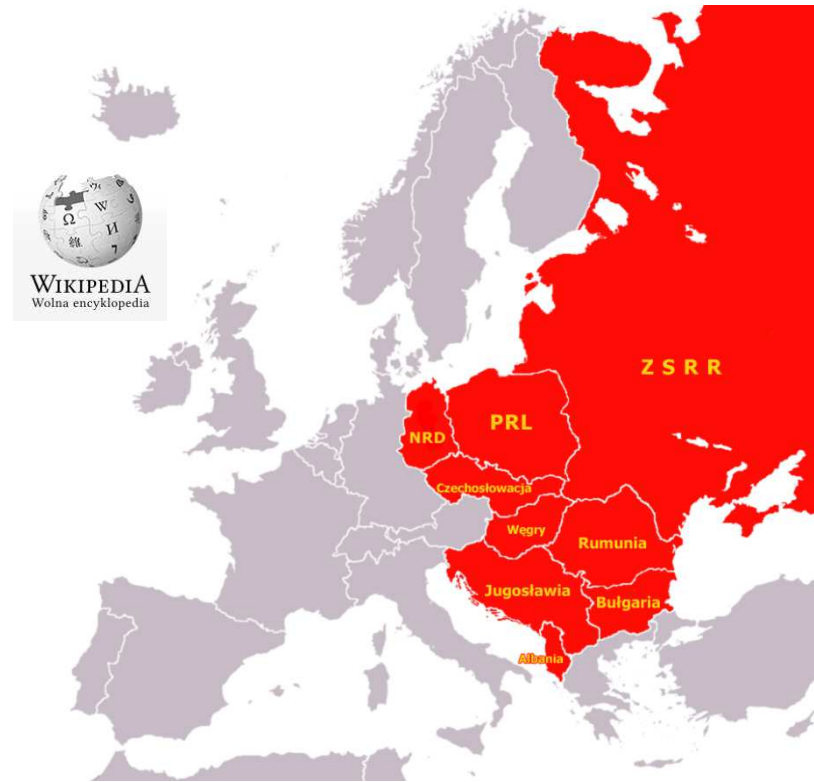
Państwa bloku wschodniego w Europie