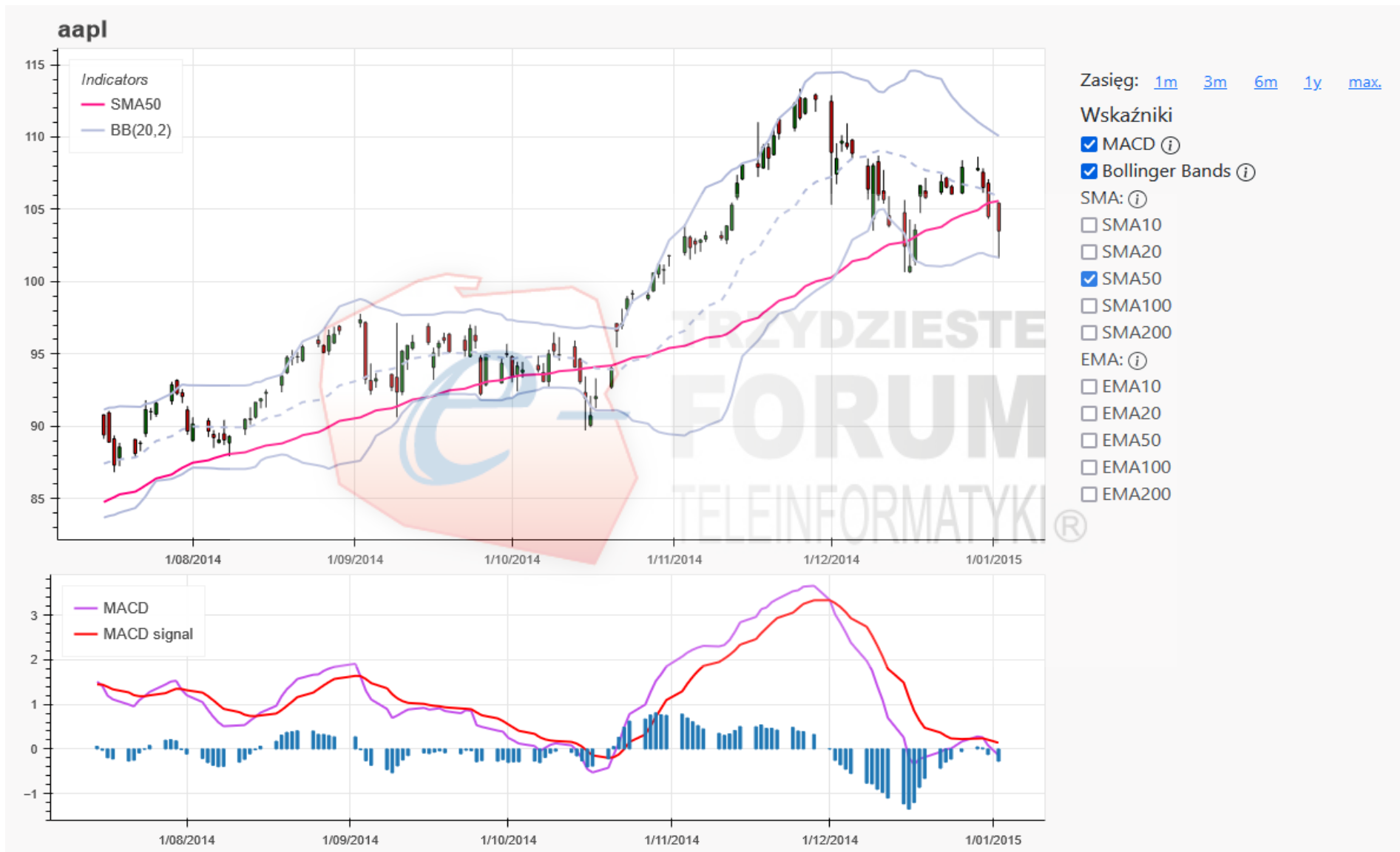
Zaawansowana analiza akcji Apple