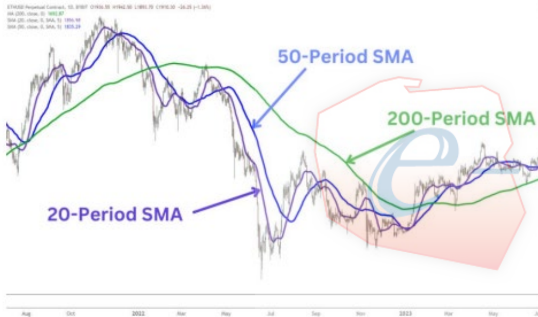
Średnia krocząca prosta (SMA)